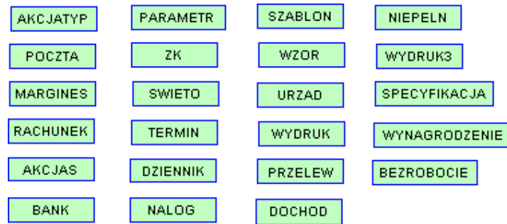
Rysunek 2 – Pozostały diagram związków encji